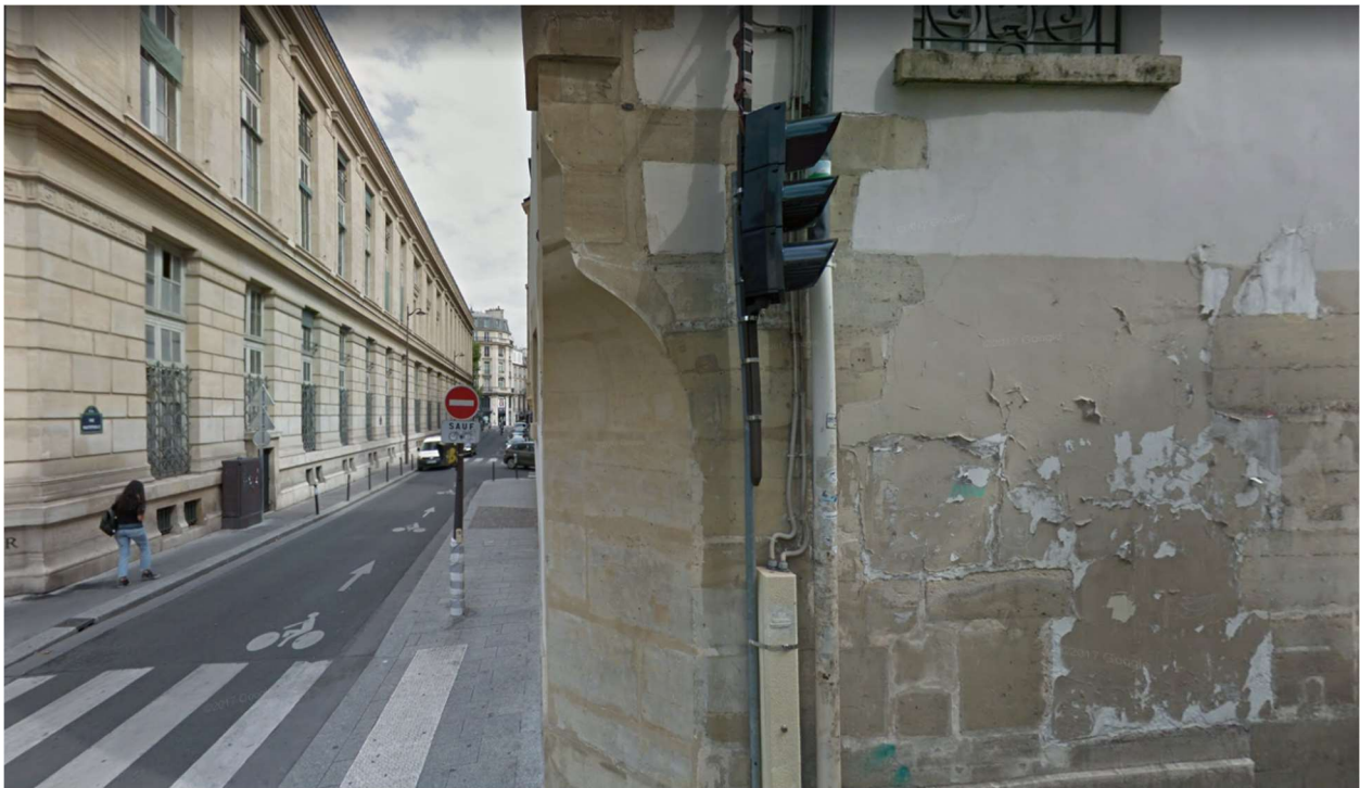
Rue de l'École de Médecine, Paris