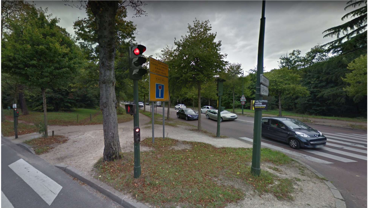
Allée de la Reine Marguerite, Paris