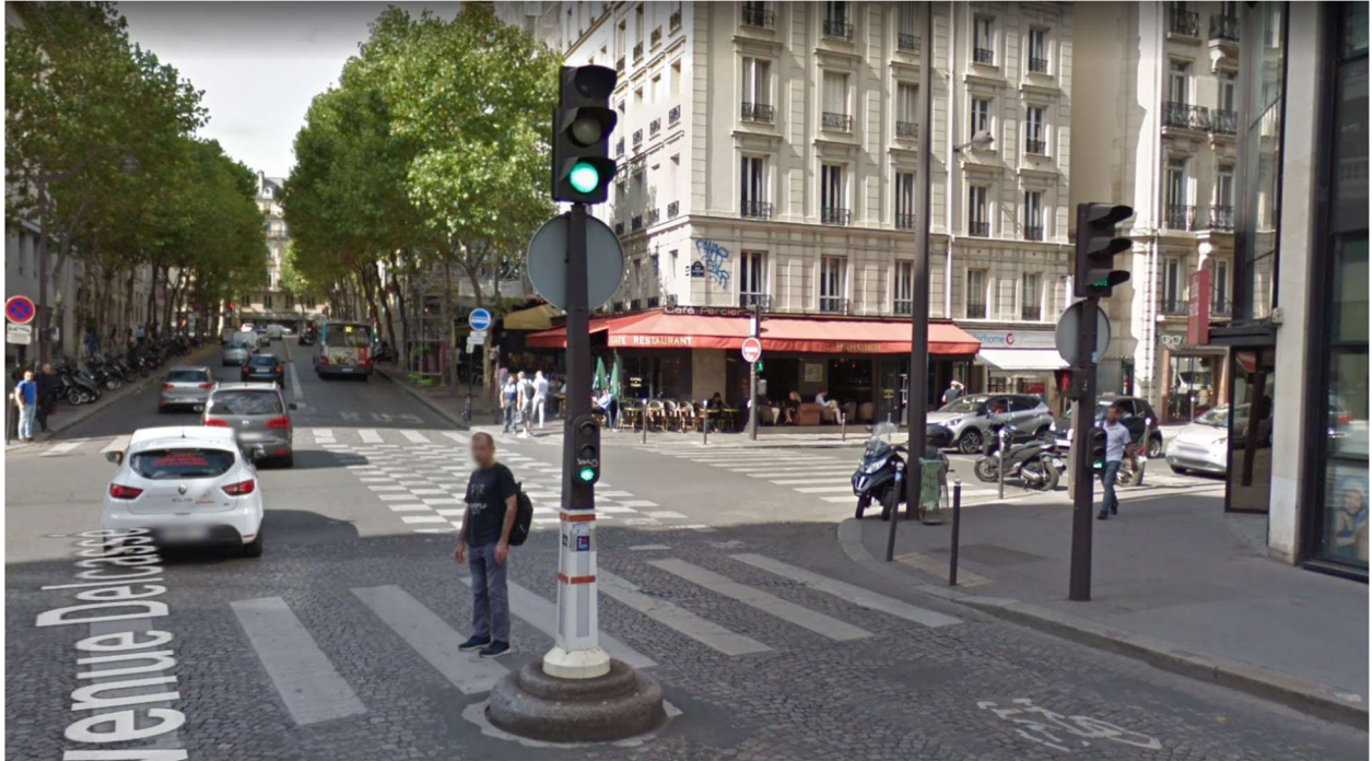
Avenue Delcassé, Paris