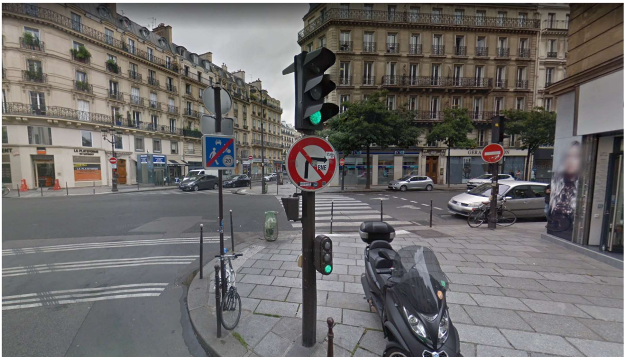
Rue des Gravilliers, Paris